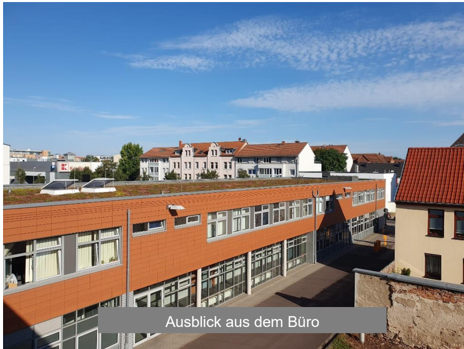
Ausblick aus dem Büro