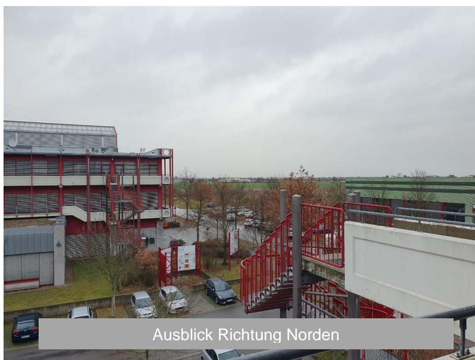
Ausblick Richtung Norden