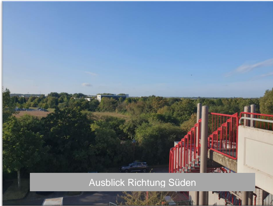
Ausblick Richtung Süden