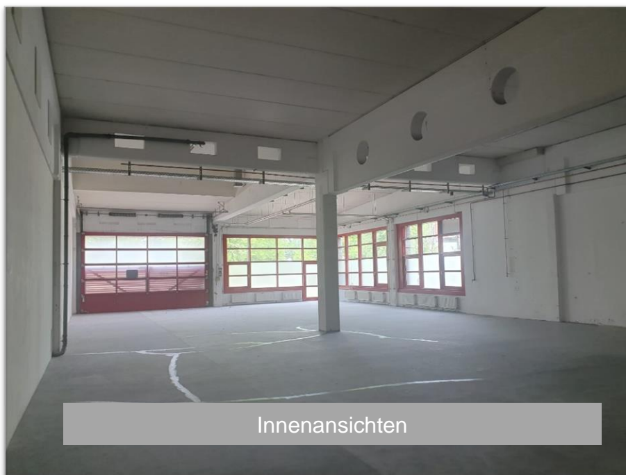
Foto der Mietfläche Q76-77