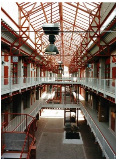
Blick in die Erschließungsstraße/Lichthof eines unserer Häuser

Ob Büro, Werkstatt, Fertigungsfläche, Versuchsfeld, Schulungsraum oder Studio – das IGZ Magdeburg bietet innovativen Unternehmen aus nahezu allen Branchen gute Entfaltungsmöglichkeiten.