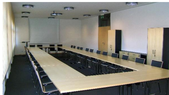
Beispiel eines Beratungsraumes