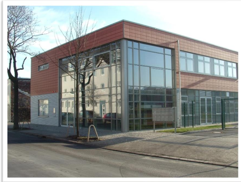
Straßenansicht / Einfahrt