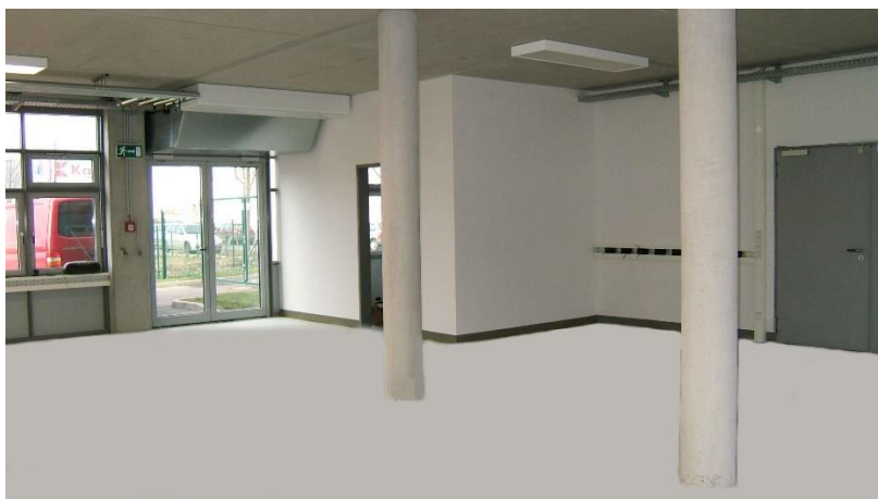
Innenansicht Werkstatt (beispielhaft)

Das Gelände ist komplett umzäunt und wird in den Dunkelstunden sowie am Wochenende von einem Wachdienst bestreift.