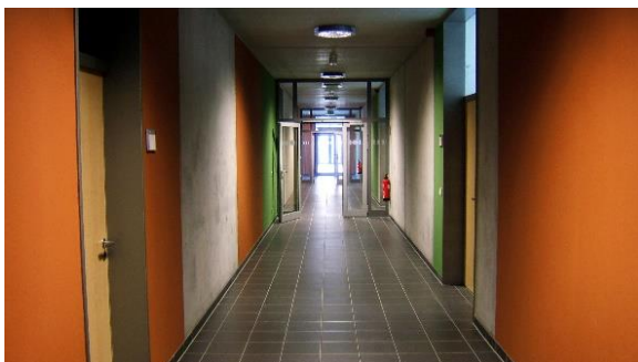
Blick in das Haus